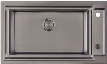
OUTLINE H25 - GUN METAL 6625 006